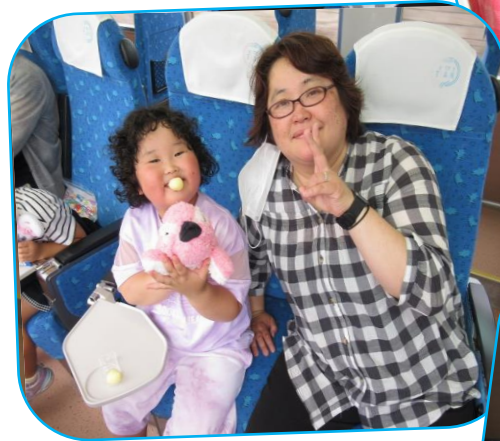
お土産もいっぱい♡