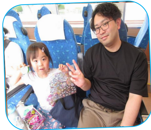
駅長さん企画の じゃんけん大会!