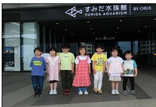
ほし組全員で楽しい思い出が作れました! お家の方のたくさんのご協力ありがとうございました(^ ^)/