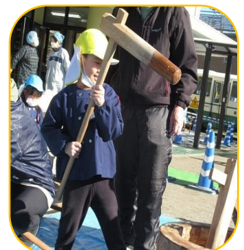
重い杵を持って、お餅つきが出来て楽しい思い出が出来ました(^^)!