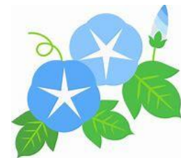
鴫田 里香 (ときた りか) おうし座

ねずみの家族が住む森に寒い冬がやってきました。ストーブの燃えている暖かい部屋でねずみの家族が楽しく過ごしている様子が可愛らしく1ページめくるのが楽しいです。ステイホームに読みたい本です。