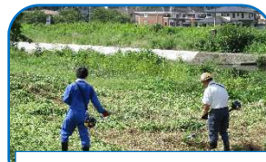
土手・河川の草刈り

朝早くから、大勢のご父母の方が参加してくださいました。園庭、第2園庭、畑、二杉橋周辺、二杉神社…等、広範囲にわたり、作業をしていただき、ありがとうございました。おかげさまで、8月26日の夏期登園日より、子ども達もきれいな環境の中で過ごすことができました。心よりお礼申し上げます。