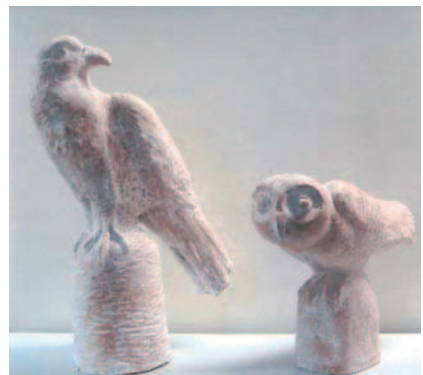
はやぶさ (H52cm) フクロウ (H30cm)

入試問題説明会を平成23年1月22日(土)学園教育センターで行います。詳細はホームページで。